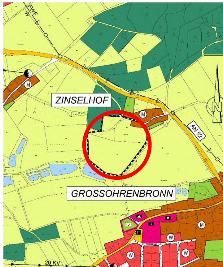
Abbildung 1: Auszug Flächennutzungsplan Markt Dentlein a.F.

Gegenwärtig stellt der Flächennutzungsplan für den Bereich weitestgehend eine landwirtschaftliche Nutzfläche dar.